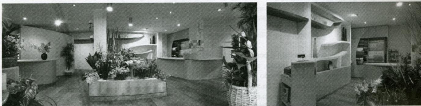
Figura 7.2 – Interior design Feng Shui, arch. R. Giovanardi, fioreria "Il bocciolo" Bologna

Il Feng Shui inteso come ambiente terapia può contribuire attraverso l'utilizzo delle due forze naturali del Vento e dell'Acqua in sinergia con l'uso di colori, di materiali ecocompatibili, della luce naturale, dei cristalli, a riqualificare e rivitalizzare gli ambienti interni. Numerosi esempi di architetture ecosostenibili come il già citato complesso dell'Ing Bank ad Amsterdam progettata dall'architetto Ton Alberts, rappresentano esempi significativi di come l'architettura naturale possa aumentare la qualità della vita e molte volte ridurre l'assenteismo (15% nella Ing Bank).