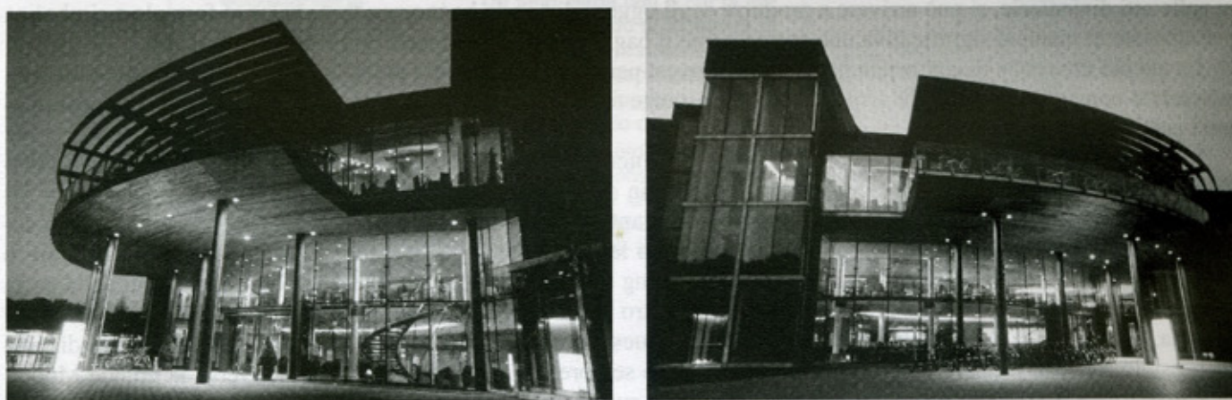
Figura 7.3 – Vista dell'ingresso dell'Intercontinental Hotel

L'hotel Inter-Continental progettato dal designer Peter Rosserbach in collaborazione con un team di architetti londinesi è stato costruito in ogni suo spazio rispettando i principi del Feng Shui. Si trova a Loipersdorf, provincia austriaca della Stiria. Ogni spazio è stato pensato per evocare un senso di benessere, tranquillità e relax totale. Le luci dei corridoi, le light-shower sono soffuse e colorate. I blu e gli azzurri richiamano l'Elemento Acqua mentre i rossi e gli arancio l'Elemento Fuoco. La luce del foyer è riflessa sul soffitto tramite il movimento dell'acqua delle due piscine una interna e una esterna.