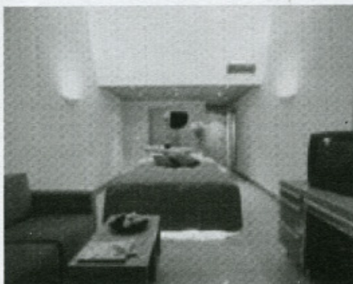
Figura 7.4 – Particolare dell'interno di una stanza